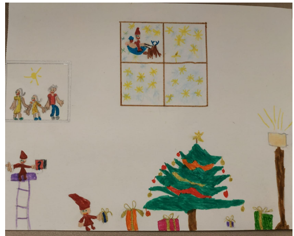
Aileen Viollet CP